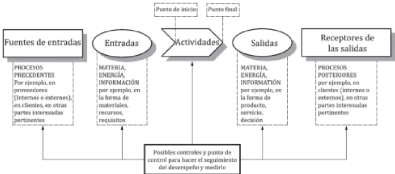
Figura 1 – Representación esquemática de los elementos de un proceso

La Figura 1 proporciona una representación esquemática de cualquier proceso y muestra la interacción de sus elementos. Los puntos de control del seguimiento y la medición, que son necesarios para el control, son específicos para cada proceso y variarán dependiendo de los riesgos relacionados.